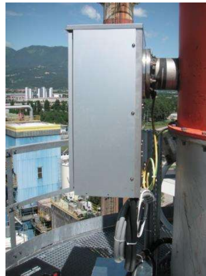
Installation de l'unité de prélèvement