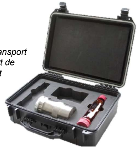
Valise de transport pour support de prélèvement