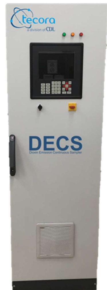
Unité de Contrôle

Les spécifications techniques peuvent changer sans avertissement